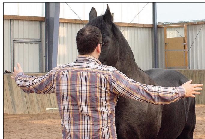
Ausprobieren und Angst überwinden: Wie viel Druck ist erforderlich, um Dürrer in Bewegung zu setzen?