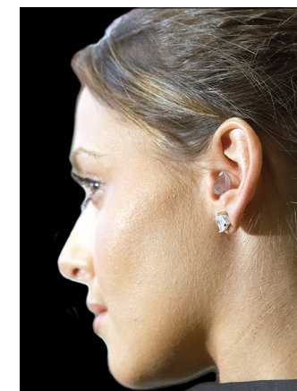
Dezent: Die Stöpsel aus einer transparenten Polymerrezep-tur sind waschbar und lassen sich wiederverwenden.

Als Schutz des Gehörs vor dauerhaften Schäden für Service-Mitarbeiter eignen sich neue transparente waschbare Gehörschutzstöpsel. Ihr integrierter Hochpräzisionsfilters reguliert den Geräuschfluss derart, dass sie den Geräuschpegel wirksam reduzieren, ohne jedoch die Sprachverständigung einzuschränken.